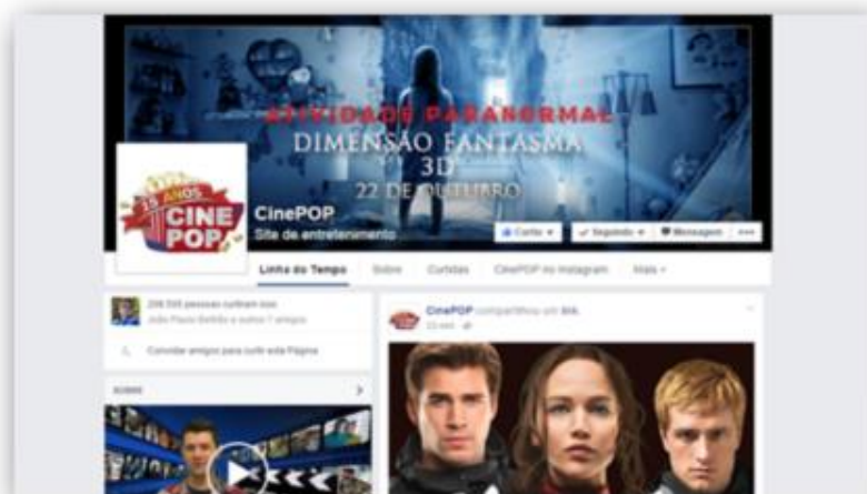
FOTO COBERTURA DE PRÉ-ESTRÉIAS, COLETIVAS DE IMPRENSA E CENAS EXCLUSIVAS!